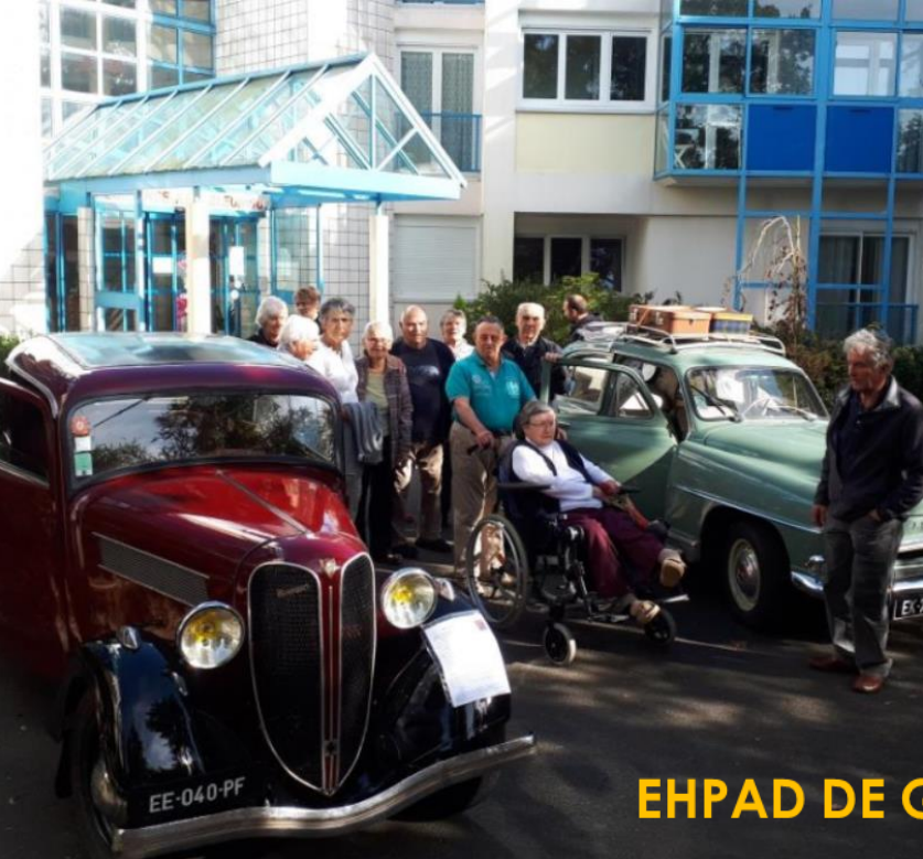
EHPAD DE GOUESNOU