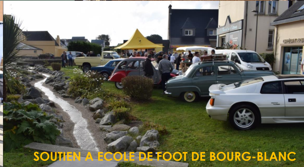
SOUTIEN A ECOLE DE FOOT DE BOURG-BLANC