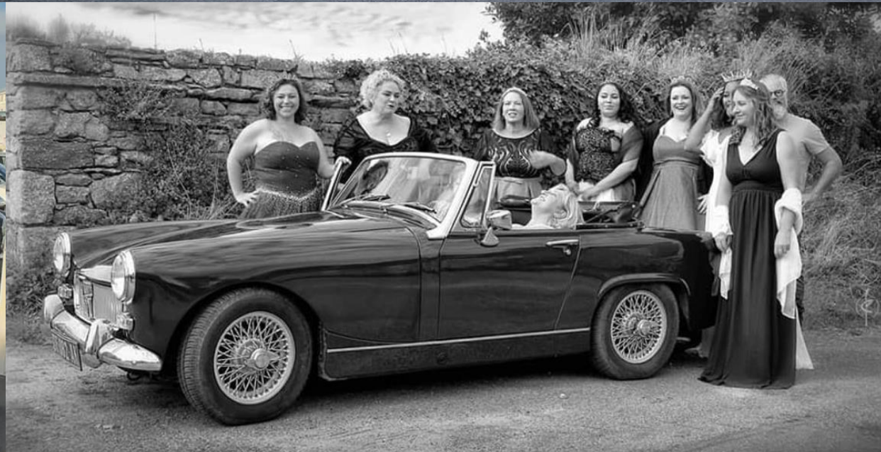
Shooting pour les Élégantes courbes