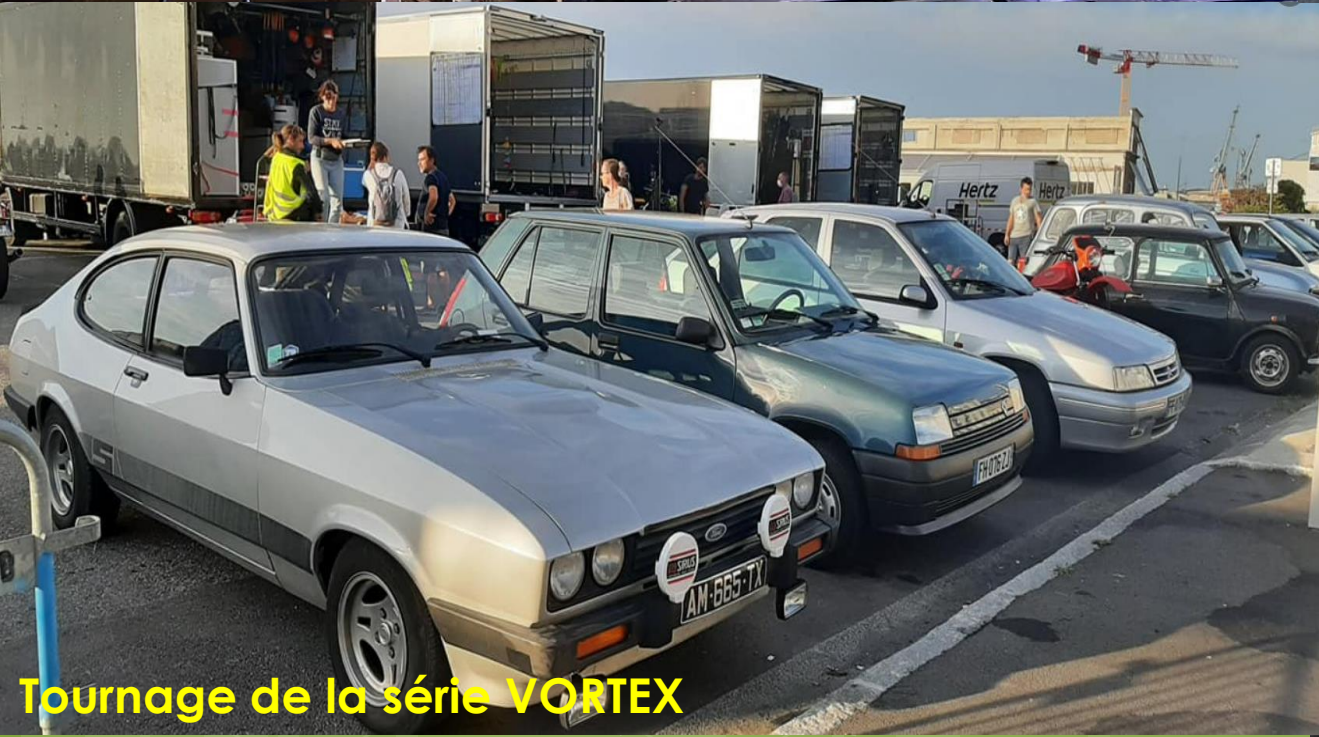
Tournage de la série VORTEX