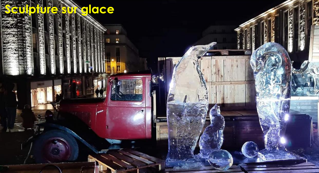
Sculpture sur glace