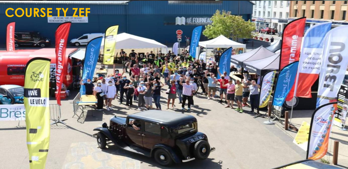
COURSE TY ZEF