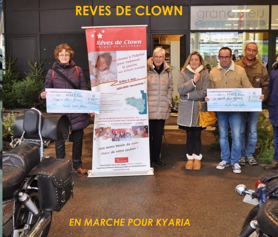
EN MARCHÉ POUR KYARIA